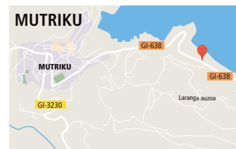
Barrio Laranga auzoa Transferentzia Planta (2 km-ra Debako errepidean) Estación de Transferencia (a 2 km dirección Deba)