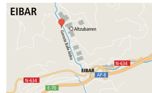
Polígono Acitain poligonoa Gorosta Balle 21 - A