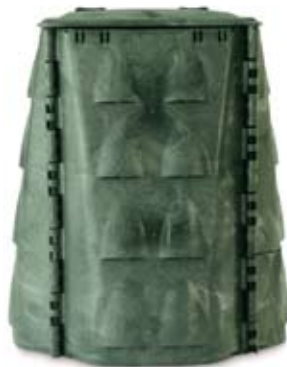
Compostador de varilla.