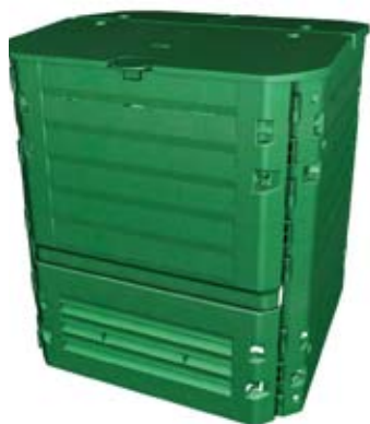
Compostador de pestaña.