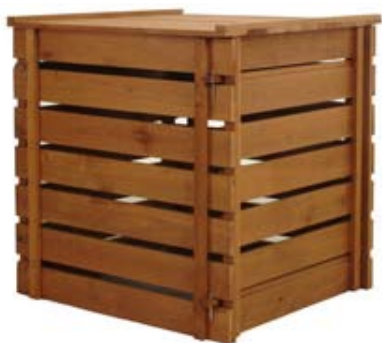
Compostador de listones.